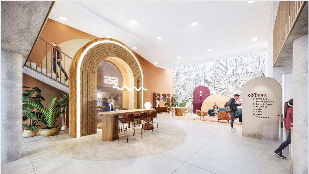
Un hall qui répond aux nouveaux codes du travail décoré par Yad Space